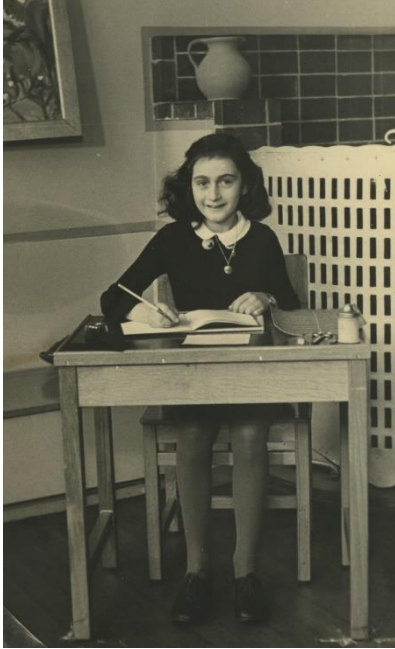
Anne u posljednjoj godini osnovne Montessori škole, 1940.

https://www.annefrank.org/en/anne-frank/who-was-anne-