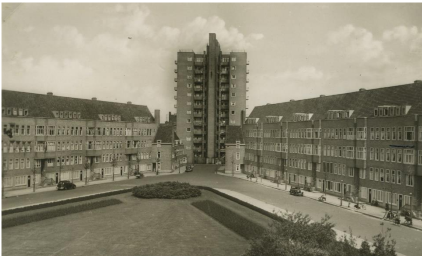
Merwedeplein, Amsterdam, mjesto gdje je živjela obitelj Frank.

Ubrzo se Anne u Nizozemskoj osjećala kao kod kuće. Naučila je jezik, stekla nove prijatelje i išla u nizozemsku školu u blizini svoje kuće. Njezin je otac naporno radio kako bi pokrenuo svoj posao, ali nije bilo lako. Otto je također pokušao osnovati tvrtku u Engleskoj, ali je plan propao. Stvari su krenule na bolje kada je osim pektina počeo prodavati i bilje i začine. 1. rujna 1939., kada je Anne imala 10 godina, nacistička Njemačka napala je Poljsku i tako je započeo Drugi svjetski rat. Nedugo zatim, 10. svibnja 1940., nacisti su napali i Nizozemsku. Pet dana kasnije, nizozemska vojska se predala. Polako, ali sigurno, nacisti su uvodili sve više zakona i propisa koji su otežavali živote Židova. Na primjer, Židovi više nisu mogli posjećivati parkove, kina ili nežidovske trgovine. Pravila su značila da je sve više i više mjesta postalo zabranjeno za Anne. Njezin je otac izgubio tvrtku jer Židovima više nije bilo dopušteno voditi vlastiti posao. Sva židovska djeca, uključujući Anne, morala su ići u zasebne židovske škole.